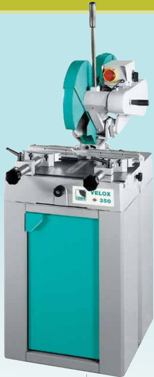
OPTIONAL h 895mm

FR - Tronçonneuse manuelle à fraise-scie pour coupes à 45° droite/gauche et obliques jusqu'à 45° de l'aluminium et/ou matériels légers (02.) Arrêts automatiques à 0, 15, 30, 45° droite/gauche.